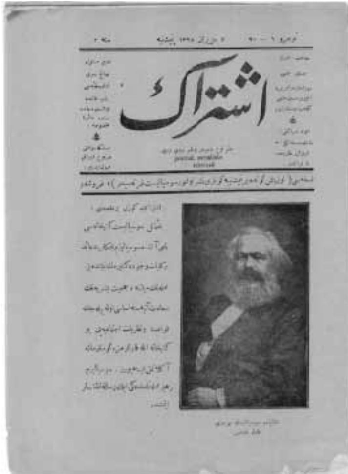
USTE'NİN 65. KURULUŞ YILI NEDENİYLE TÜRKİYE BÖLÜMÜ'NÜN ÇIKARDIĞI KART.