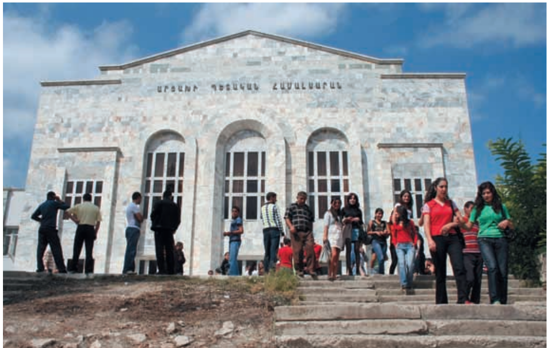
De staatsuniversiteit in Stepanakert

Zenuwachtig loopt de jongen van de studentenorganisatie heen en weer. Hij grist een mobiele telefoon uit z'n broekzak en begint driftig te bellen. Als hij ophangt, schudt hij z'n hoofd. Een interview over het universiteitsleven in Nagorno-Karabach, dat gaat niet zomaar. 'Eerst moeten we toestemming hebben van de rector,' zegt hij. Maar de rector is er niet, en het is onduidelijk of hij de komende dagen nog terugkomt. Ook docenten, decanen en andere leden van de studentenorganisatie zijn niet bereid te praten. Ze kijken op van hun bureau, luisteren geduldig naar de vraag, en schudden dan hun hoofd. Geen interviews. 'Iedereen is voorzichtiger geworden,' zegt de tolk na de zoveelste afwijzing. 'Een tijd geleden was er ook een journalist, en dat bleek een spion te zijn uit Azerbeidzjan. In zijn artikel schreef hij dat de studenten het helemaal niet naar hun zin hebben hier, dat ze ontevreden zijn en het veel beter zouden hebben wanneer Nagorno-Karabach weer deel uit zou maken van Azerbeidzjan. Sindsdien durft niemand meer met journalisten te praten.'