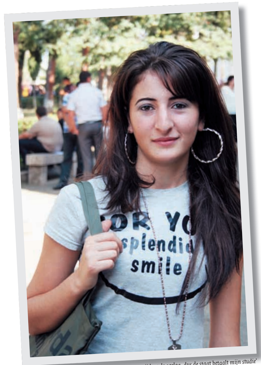
‘Mijn vader is omgekomen tijdens de oorlog, dus de staat betaalt mijn studie’