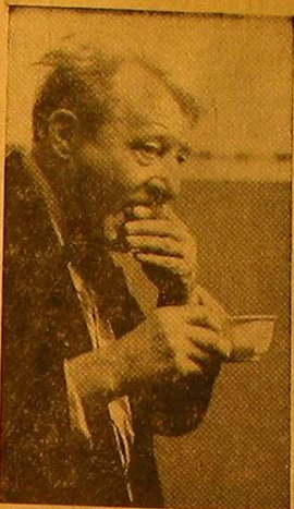
„ZO IS HET“, roept de volle neef van de Duitse Hans Albers