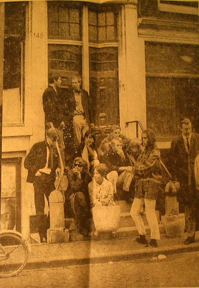
Wachten op de opening van een expositie