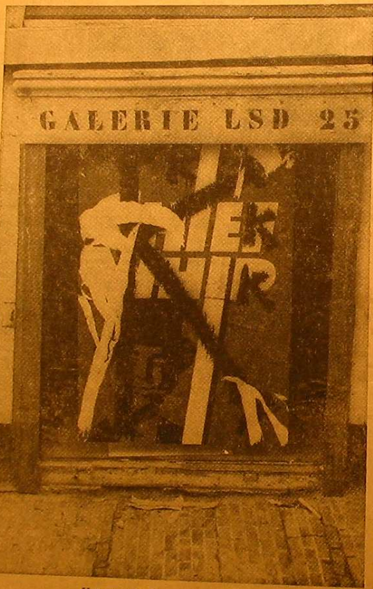
Het psycho-chemische middel LSD

Het zijn geoevende leden, want terwijl andere sprekers als bilien zoomen om onuitputtelijkheden als bijvoorbeeld primitivisme en evolutie, komen zij met de mokerslagen. „De militairen zijn de nakomelingen van de koppersnellers. Zoals de koppersneller trots