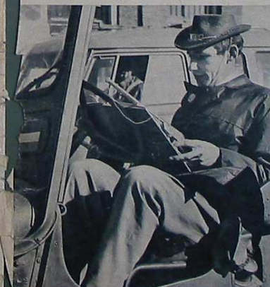
Feenstra wil orde scheppen in de geleerden der ordelozen. Het anarchisme, dat uitgestorven leek, wordt door hem en de zijnen nieuw leven ingeblazen.