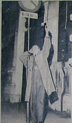
Een niet van naam bekende rangpedagoog oefent kraak op straat om zijn stem wat los te maken.

Nu zou ik een paar dingen graag willen weten. Wie heeft de inrichting van die anti-rooktempel betaald? Een glazenwasser kon dat niet opbrengen, zelfs niet als hij geld toegestopt kreeg van reclamebureaus opdat hij tenminste met zijn kornduiven van de aanplakbiljetten zou afbliven. Wie was eigenaar van het gebouw? Hij moet een vermogend man zijn geweest, want de grond aan het Leidseplein wordt met goud betaald. Maar ik heb nog iets merkwaardigers. Zoals ik al gezegd heb, werd de anti-rooktempel in april 1962 in brand gestoken. Welnu, dit is een schijnbrand geweest, een doorgestoken kaart.