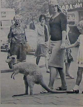
Alles kan in A'dam, zelfs een ommetje maken met een kangoeroe. Dat wordt dagelijks bevestigd. Wat maakt het uit of het 'n hondje of een kangoeroe is?