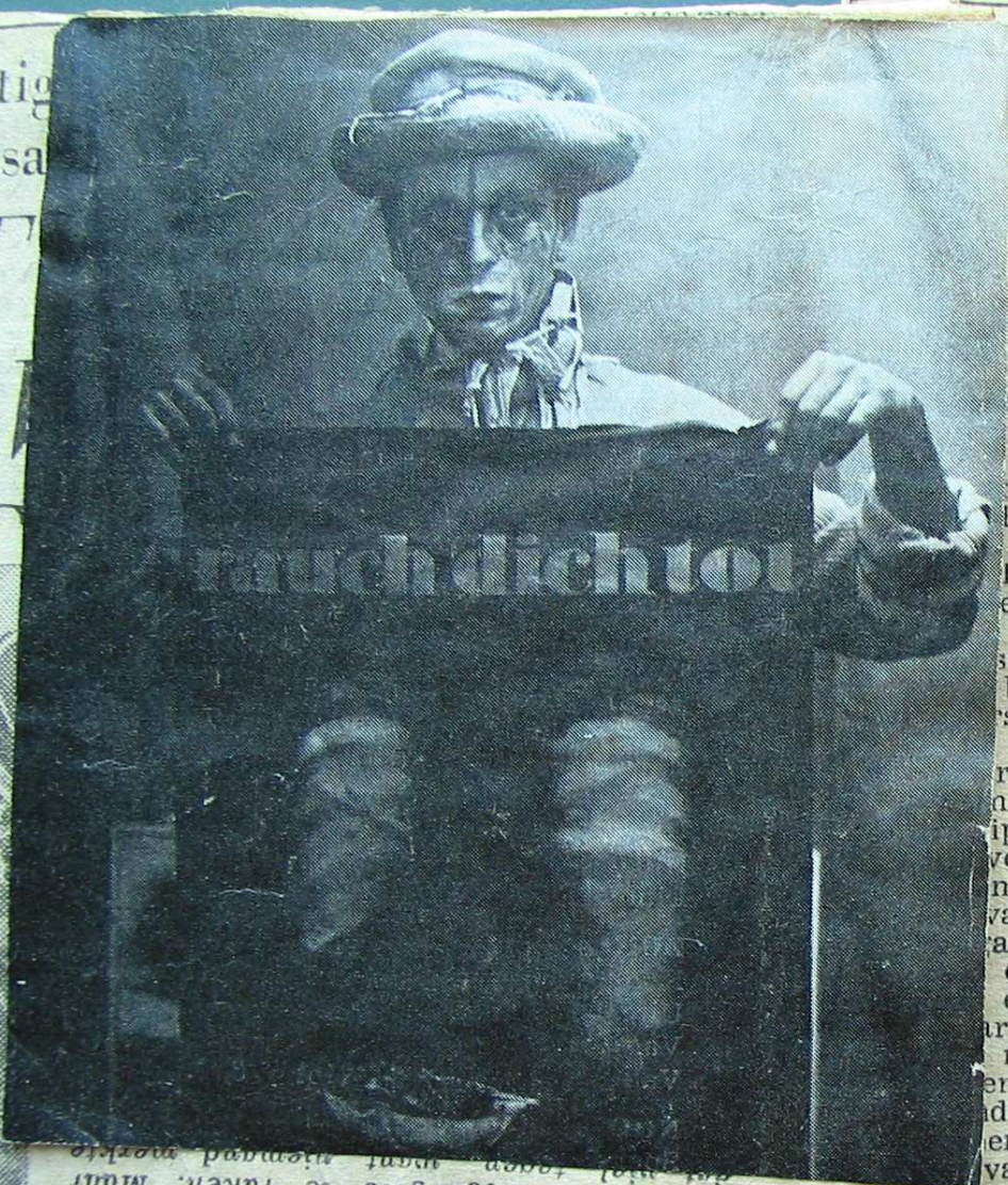
van de voorbijkangere te raken. Maar