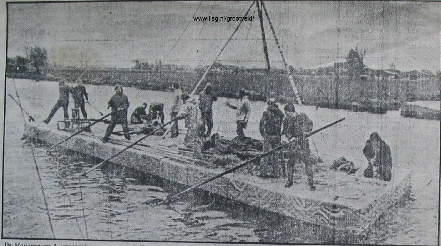
De Management I, verwaaid in een sneeuwjacht.

lasten. Hij had graag enige zeilmanoeuvres met het vlot, dat naar de aard van de cursus Management I was gedoopt willen beproeven.