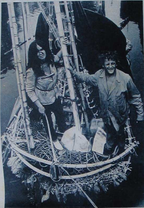
De Tand des Tijds, aldus de bouwer, is niet alleen kunst maar tevens onderdeel van een wetenschappelijk experiment.

Een van de jongens op de kade zegt spijtig: „Toch jammer dat ze straks te pletter slaan.”