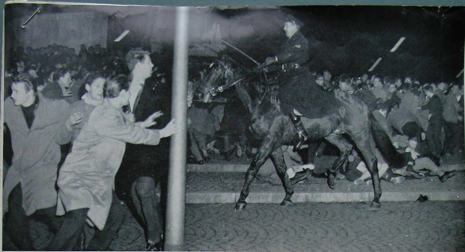
Opstootjes en relletjes, waaraan maar al te dikwijls de politie te pas moet komen, demonstreren al heel duidelijk de intenties van een deel van onze jeugd, die voor weinig terugdeinst.