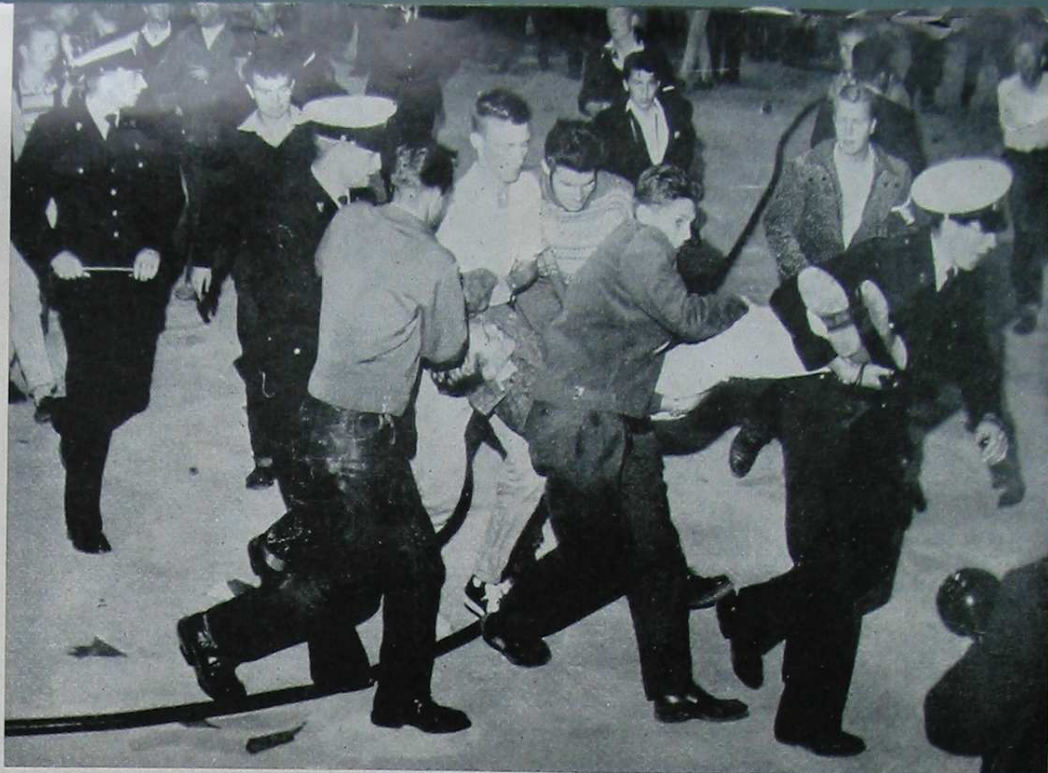
Dit is geen foto uit Amsterdam maar uit Oslo, waar men een al even felle strijd tegen het noezendom heeft te voeren als elders.

Enige tijd geleden werd van Zwitserland uit de hulp van de Nederlandse politie ingeroepen door middel van een verzoek tot terugbrenging van enkele minderjarige Nederlandse meisjes die zich in hun werk in Zwitserland zó ernstig misdroegen dat hun aanwezigheid in dat land niet langer gewenst was. Het betrof hier een dansgroep uit Nederland, onder de naam Dominiques-show optredende in een Zwit-