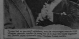
Robert Jasper Grootveld in de ruïne van de kerk.

De kerk is een van de meest bekende Nederlanders van nu, een man die de wereld heeft veranderd. Hij is een man die de wereld heeft veranderd. Hij is een man die de wereld heeft veranderd.