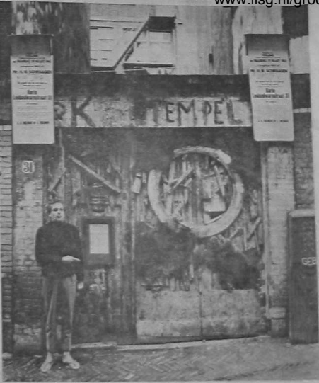
Robert Jasper Grootveld in de ruïne van de kerk.

De kerk is een van de meest bekende Nederlanders van nu, een man die de wereld heeft veranderd. Hij is een man die de wereld heeft veranderd. Hij is een man die de wereld heeft veranderd.