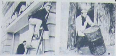
Ziehier de reportage die wij bestijns niet publiceerden omdat wij toen reeds twijfden aan deze eerder bedenkelijke humanitaire actie